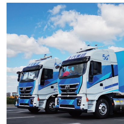
助力5G+L4级智能重卡应用落地