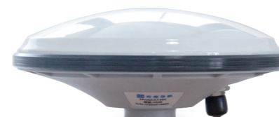
AT310 三系统八频外置天线