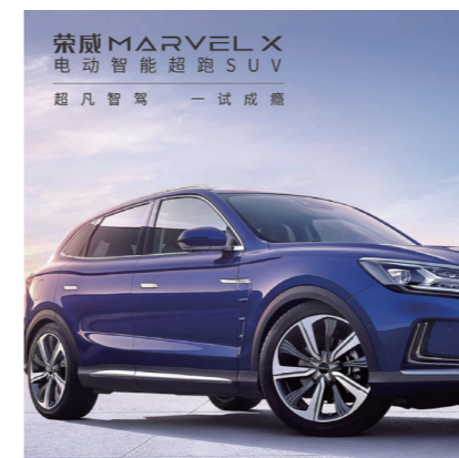
助力全球首款L3级自动驾驶车